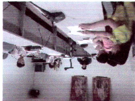
ครั้งที่ 1 เมื่อวันที่ 6 มิถุนายน 2557

สำนักงานเขตพื้นที่การศึกษาศรีสะเกษวิทยาเขต 1 ภาพกิจกรรม คณะทำงานโครงการโรงเรียนต้นแบบ (โรงเรียนดี ศรีตำบล) ปี 2557