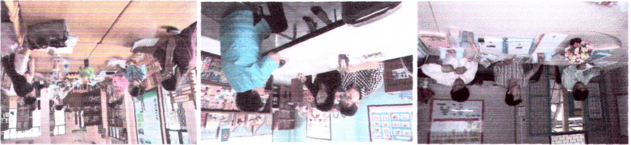
นิเทศ กำกับติดตามงานโครงการโรงเรียนต้นแบบ (โรงเรียนดี ศรีตำบล) ระหว่างวันที่ 8-16 กรกฎาคม 2557